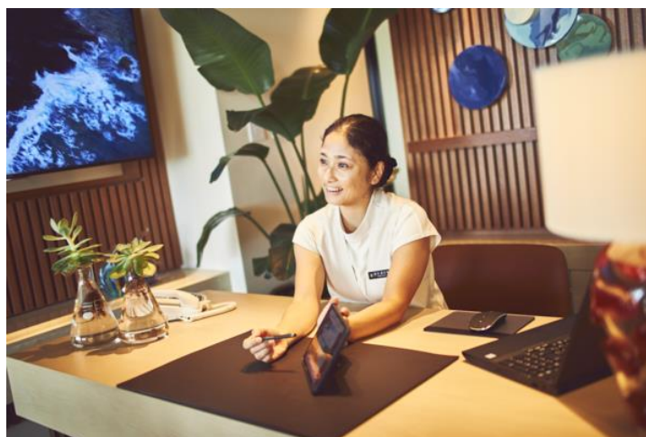
八重山での旅のプランのご相談は、リゾートセンターのコンシェルジュにお任せください

八重山で定期船を運航する安栄観光のアイランドホッピングパスは、本来、連続する3日間～5日間の3通りの利用期間(波照間島航路を含むもの3種、含まないもの3種)を販売しているが、同宿泊プランでは滞在期間中の2日間分の日にちを自由に選ぶことができ、更には高い人気を誇る波照間島を含む全航路の利用ができるフリーパスを特別にご準備致しました。そして、通常はオプションに含まれていないホテルと石垣港離島ターミナル間の安栄観光による送迎バスの予約ができるなど、3連泊の滞在をするからこそ八重山の島々を楽しむ尽くすことができるおすすめプランです。