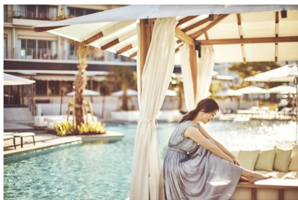
旅の間にはサンセットプールでくつろぎのひとときを

八重山で定期船を運航する安栄観光のアイランドホッピングパスは、本来、連続する3日間～5日間の3通りの利用期間(波照間島航路を含むもの3種、含まないもの3種)を販売しているが、同宿泊プランでは滞在期間中の2日間分の日にちを自由に選ぶことができ、更には高い人気を誇る波照間島を含む全航路の利用ができるフリーパスを特別にご準備致しました。そして、通常はオプションに含まれていないホテルと石垣港離島ターミナル間の安栄観光による送迎バスの予約ができるなど、3連泊の滞在をするからこそ八重山の島々を楽しむ尽くすことができるおすすめプランです。